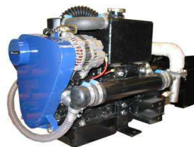
10 DMW4 Marine