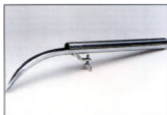
Kaapelinsuojaputki, 2-osainen kiinnityskiristimellä

Putken sisä Ø: ..... 100 mm Paino: ..... 3,6 kg Til.no.: ..... Z 849-07.01-00/0 Tele no.: ..... 871 242 129-2