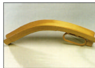
Kaapelinsuojakaari käsikahvalla ja liukuestolla

Putken sisä Ø: ..... 100 mm Paino: ..... 34 kg Til.no.: ..... Z 820-02.01-00/0