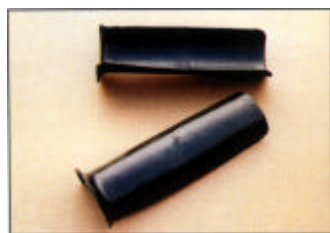
Kaapelinsuojaputki, muovinen, putkille, joiden sisä Ø 100 mm