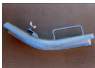
Kaapelinsuojakaari, kiinnityksellä ja kahvalla

Sisä Ø Paino Til.no: mm kg 28 0,3 Z 849-01.02-00/0 35 0,3 Z 849-01.03-00/0 40 0,3 Z 849-01.04-00/0 50 0,4 Z 849-01.05-00/0