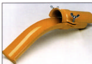
Kaapelinsuojakaari, 2-osainen kiinnityskiristimellä

Sisä Ø Paino Til.no: mm kg 28 0,4 Z 849-03.03-00/0 35 0,5 Z 849-03.04-00/0 40 0,6 Z 849-03.02-00/0 50 0,7 Z 849-03.06-00/0