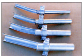
Kaapelin suojaputki, 2-osainen ilman kiinnitystä

Sisä Ø Paino Til.no: mm kg 28 0,4 Z 849-06.01-00/0 35 0,5 Z 849-06.02-00/0 40 0,6 Z 849-06.03-00/0 50 0,7 Z 849-03.06-00/0