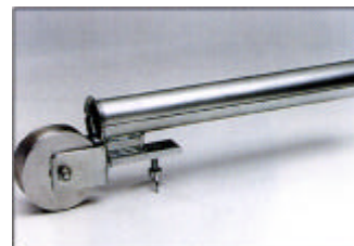
Kaapelin ja köydensuojarulla, 2-osainen, pyörivä ja lukittava, sinkitty

Putken sisä Ø: ..... 100 mm Paino: ..... 3,4 kg Til.no.: ..... Z 849-03.12-00/0