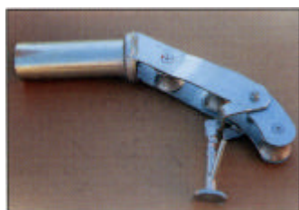
Köyden ulosvienti-laite, sinkitty

Sisä Ø Paino Til.no: mm kg 90 21,0 Z 802-20.09-00/0 100 22,6 Z 802-20.10-00/0 120 24,2 Z 802-20.20-00/0